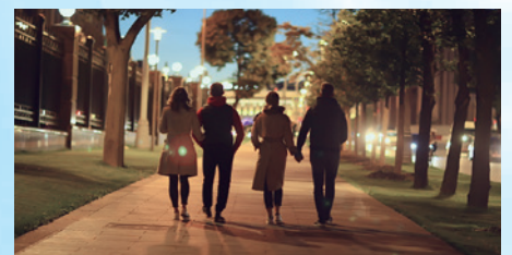
カラフルな夜間画像