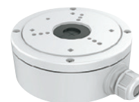
DS-1280ZJ-XS ミニバレットカメラ用 ジャンクションボックス