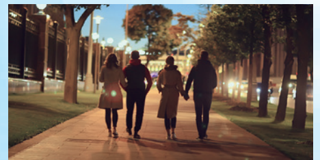
カラフルな夜間画像