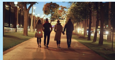
カラフルな夜間画像